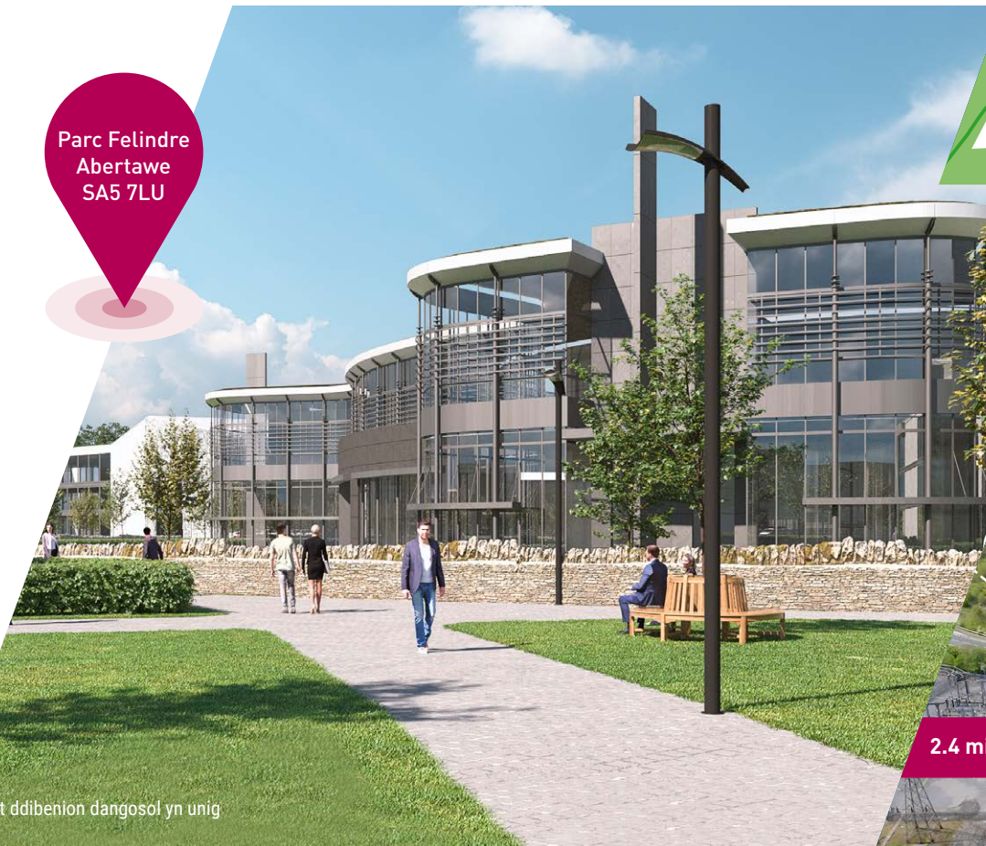
at ddibenion dangosol yn unig