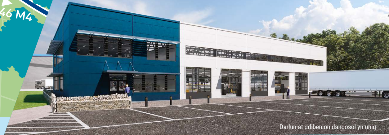
Darlun at ddiibenion dangosol yn unig

Heddiad Rhithwir: I weld lluniau gan y drôn, cliciwch yma .